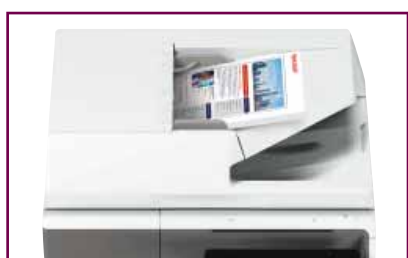
Alimentatore degli originali a singola passata fronte-retro da 100 fogli.

Le MFP MX-B455W/MX-B355W vantano una velocità di scansione in bianco e nero e a colori di 110 ipm per la rapida digitalizzazione dei documenti, consentendoti di controllare il tuo flusso di lavoro documentale.