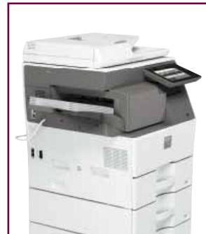
Finisher interno opzionale