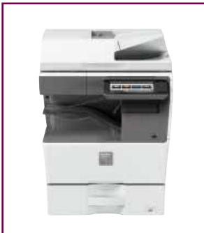
Configurazione compatta desktop

E cosa ne pensi di consentire ai visitatori di utilizzare il dispositivo, anche se non sono connessi alla rete aziendale? Abbiamo pensato anche a questo. È possibile stampare i documenti Microsoft Office direttamente dalle chiavette USB, in modo facile e veloce.