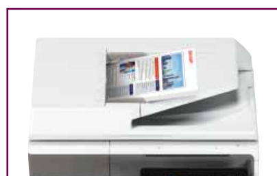
Alimentatore degli originali fronte-retro da 50 fogli.

MX-B455W offre un alimentatore degli originali a singola passata fronte-retro da 100 fogli mentre MX-B335W dispone di un alimentatore degli originali fronte-retro da 50 fogli; entrambi sono perfetti per ambienti come le reception, dove le scansioni devono essere eseguite in modo tempestivo.