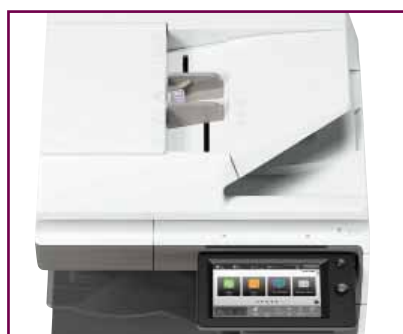
Acquisisci carte d'identità e biglietti da visita

E poiché sappiamo che le tue esigenze di scansione non si limitano ai documenti, puoi acquisire in modo rapido e accurato anche carte d'identità e biglietti da visita.