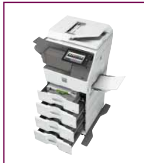
Capacità carta ampliabile.